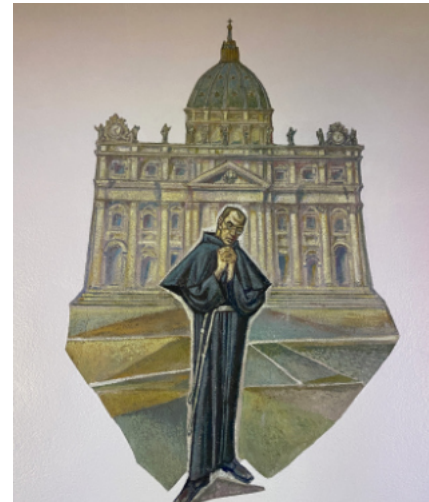
... studiuje w Rzymie.