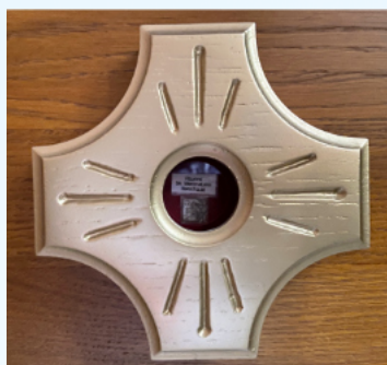
Relikwie św. Maksymiliana Kolbego - włosy