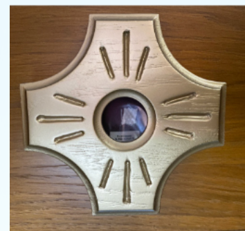
Relikwie św. Jana Pawła II - fragment pasa sutanny