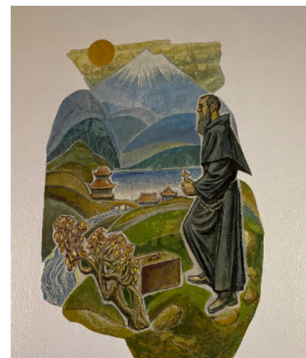
... jedzie do Japonii.