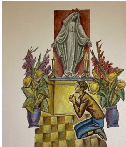
... wybiera dwie korony.