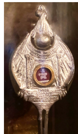
Relikwie św. Faustyny Kowalskiej - kości