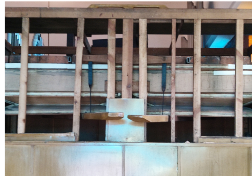
Na zdjęciu widać miech, w którym zostały zaklejone białą skórą wszystkie pęknięcia, przez które uciekało powietrze.