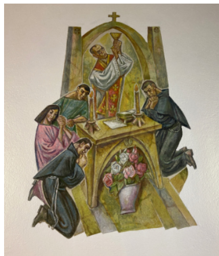
... z braćmi na misjach.