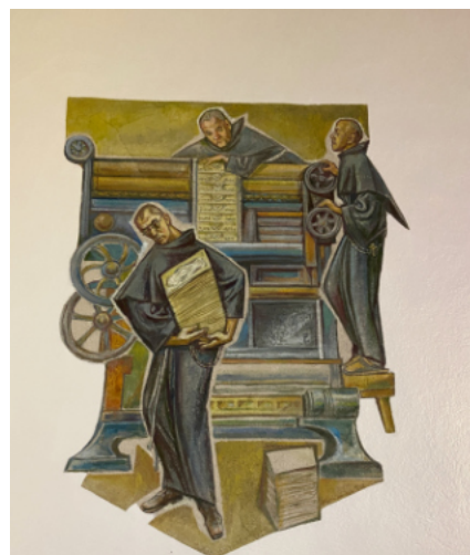
... zakłada drukarnię.