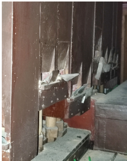
Na obu zdjęciach widać piszczałki sekcji pedałowej mocno zeżarte przez drewnojady i nie nadające się do konserwacji.

Organy naszego kościoła zostały złożone w dawnej kaplicy św. Antoniego w 1957 r. przez firmę Fryderyka Schwarza z używanych części. Po wybudowaniu obecnego kościoła organy zostały do niego przeniesione i powiększone. Prospekt rozbudowanego instrumentu został podzielony na 3 części. Lewa część zawiera piszczałki sekcji 2. manuału i część piszczałek sekcji 1. manuału. Środkowa część zawiera piszczałki Pryncypału 16' oraz część piszczałek Pryncypału 8'. W prawej części zostały ulokowane piszczałki sekcji 1. manuału oraz reszta piszczałek sekcji 1. manuału.