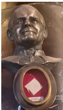
Relikwie św. Jana Pawła II - fragment pasa sutanny