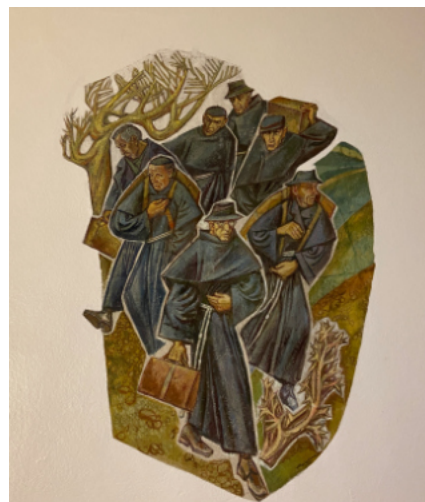
... uprowadzony do obozu.