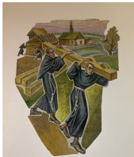
... buduje Niepokalanów.