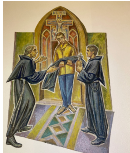
... wstępuje do zakonu.