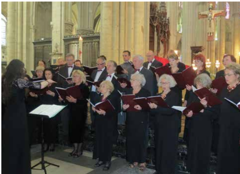
(zdj. 3)