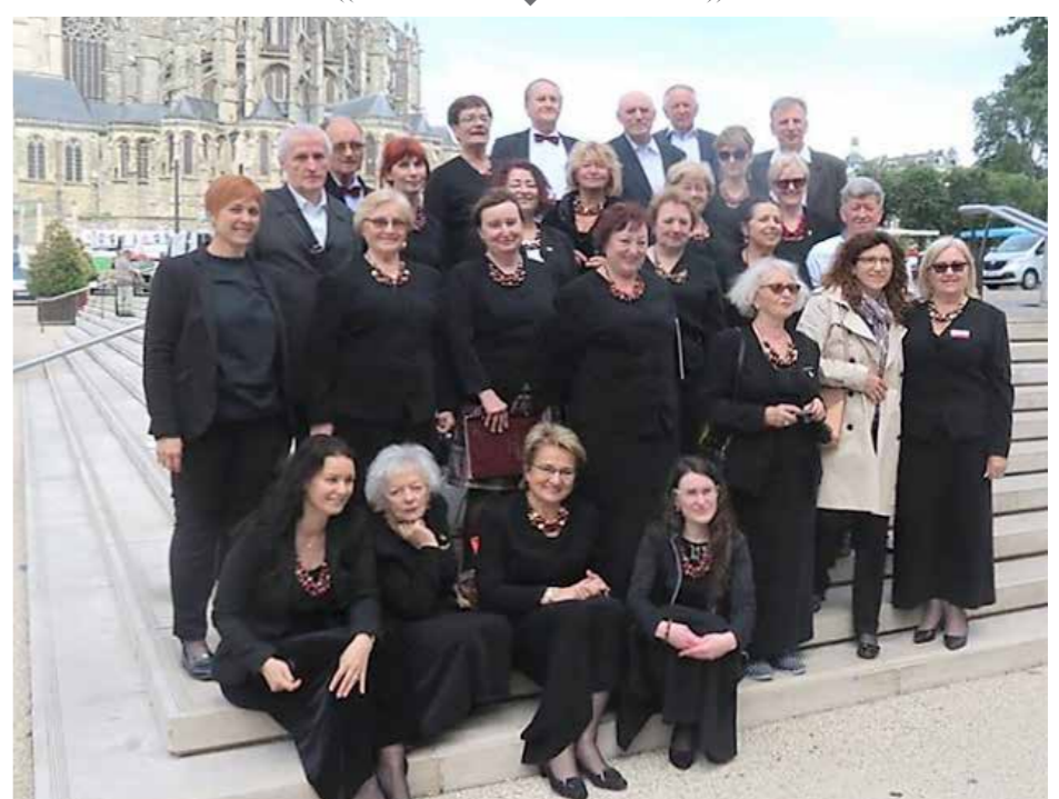
(zdj. 1)

(zdj. 2) 04.06.2017 r. godz. 12.30 - Odświeżenie w katedrze tablicy pamiątkowej poświęconej Błękitnej Armii Gen. Józefa Hallera. W tym czasie Chór „Symfonia” pod dyrekcją Bogny Swiżło wykonał utwory patriotyczne jak: „Hej Orle Białe”,