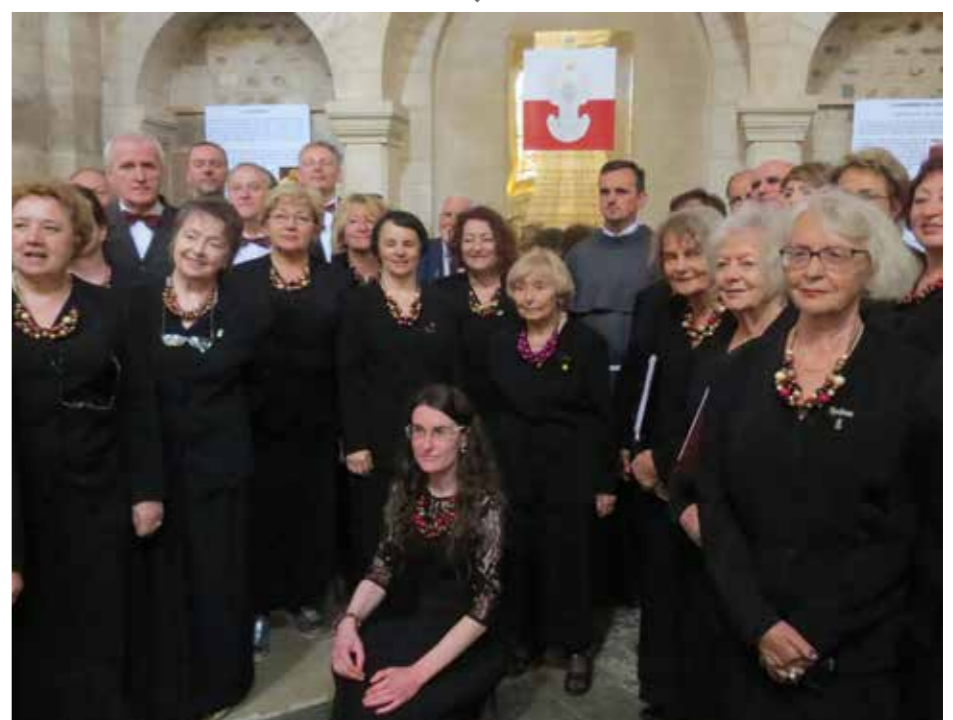
(zdj. 2)