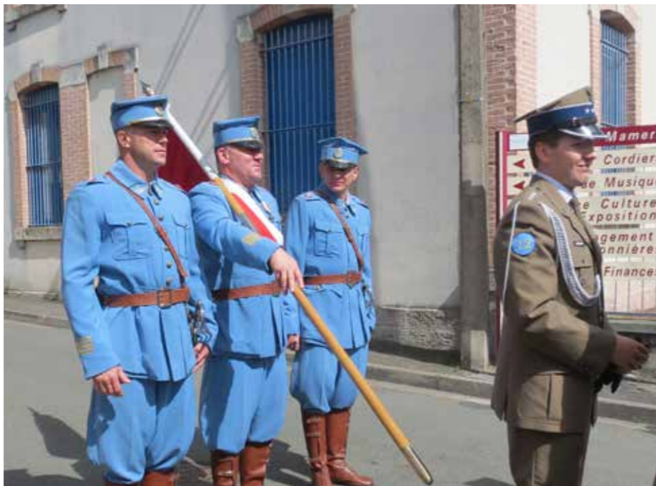
(zdj. 4)

„Życie to czas, w którym szukamy Boga. Śmierć to czas, w którym Go znajdujemy. Wieczność to czas, w którym Go posiadamy” Św. Franciszek Salezy